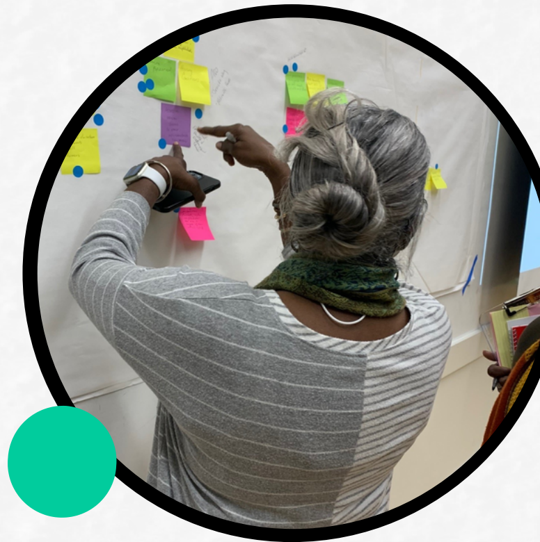
Participantes del distrito 2 trabajan juntos en priorizar situaciones relacionadas con Equidad

Los participantes expresaron su preocupación de que no estamos satisfaciendo la necesidad de una comunicación oportuna y efectiva entre el gobierno de la ciudad y los residentes, particularmente en lo que se refiere a eventos, programas y acceso de fondos . Cabe destacar que los residentes adultos de la ciudad, aproximadamente 6000 de los cuales solo hablan español (PolicyMap, 2019), tienen poco o ningún acceso a reuniones y servicios públicos básicos.