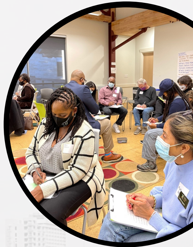
Residentes, voluntarios, y facilitadores participan en conversaciones en el distrito 2

Cada Laboratorio se comenzó con una introducción acerca de nuestro equipo (ODEI) y los integrantes. Después invitamos a los participantes a que formaran parte de una conversación en grupos donde hablarían de temas relacionados a la identidad y pertenencia. Un participante dijo: "Disfruté especialmente las discusiones que tuvimos... los participantes dieron respuestas honestas que reflejaban su pensamiento". Después de esta oportunidad de escuchar profundamente e identificar valores compartidos, los participantes enumeraron sus principales preocupaciones relacionadas con la diversidad, la equidad y la inclusión en Little Rock y luego las priorizaron como grupo. A continuación, invitamos a los participantes a compartir sus ideas de soluciones, preguntando: Si fueras 10 veces más audaz, ¿qué gran idea recomendarías para abordar estas preocupaciones? Finalmente, los participantes asignaron puntajes a las ideas, clasificando sus mejores opciones.